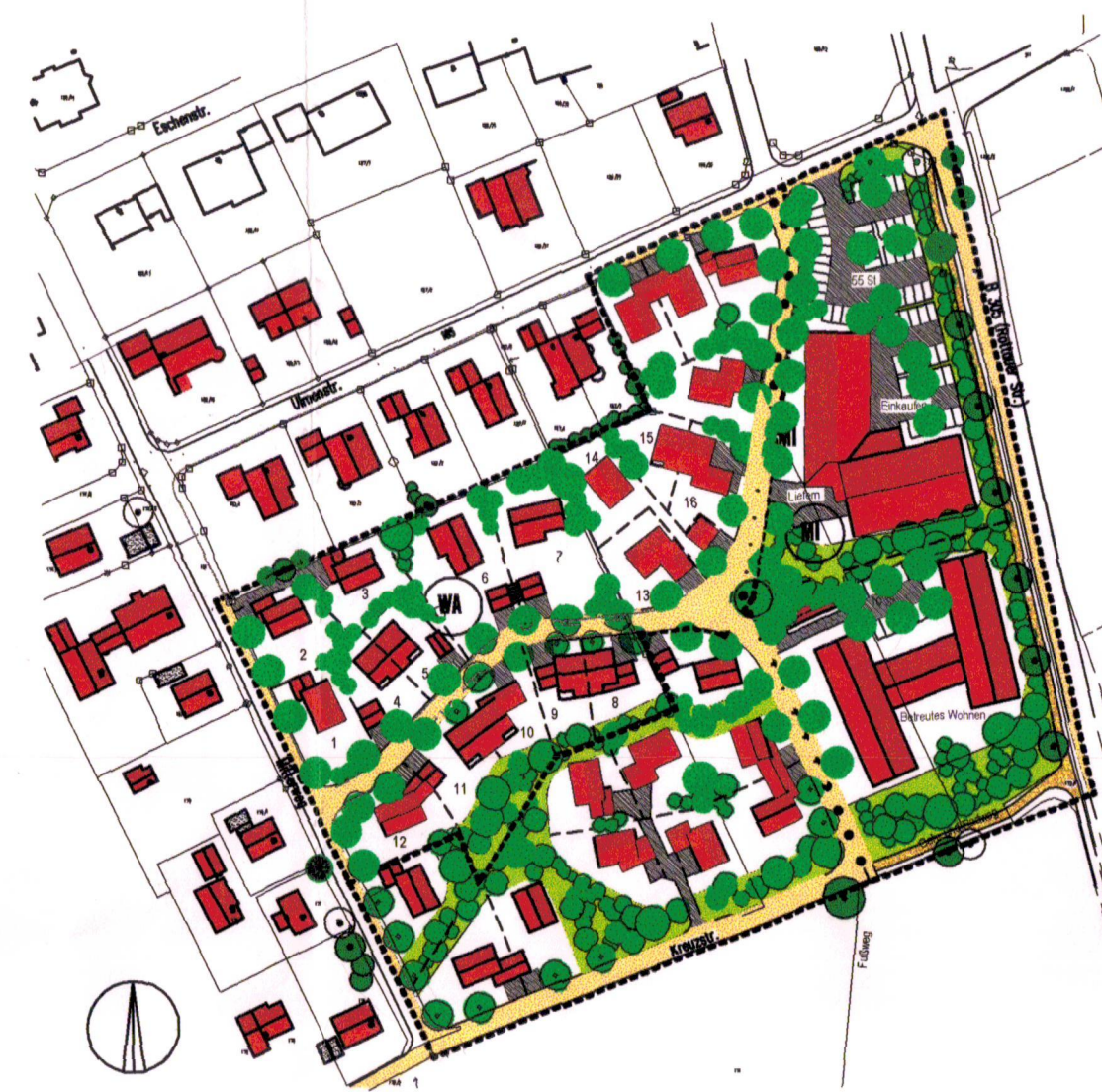
Ortsentwicklung "Bernau Süd" M 1:2000